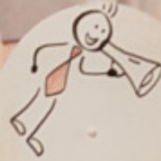
Die IG Metall ist bunt